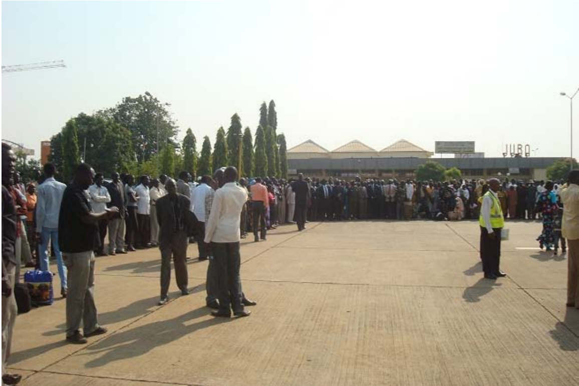
በአቀባቤ ሥነሥርዓቱ ላይ የተሰበሰበው ሕዝብና ከፍተኛ የሱዳን መንግሥት ባለሥልጣናት