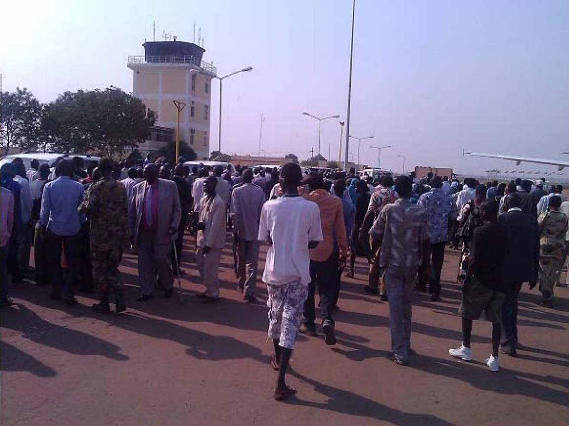
ሕዝቡ ለአቀባባል ወደ አየር ማረፊያ ሲያቀና