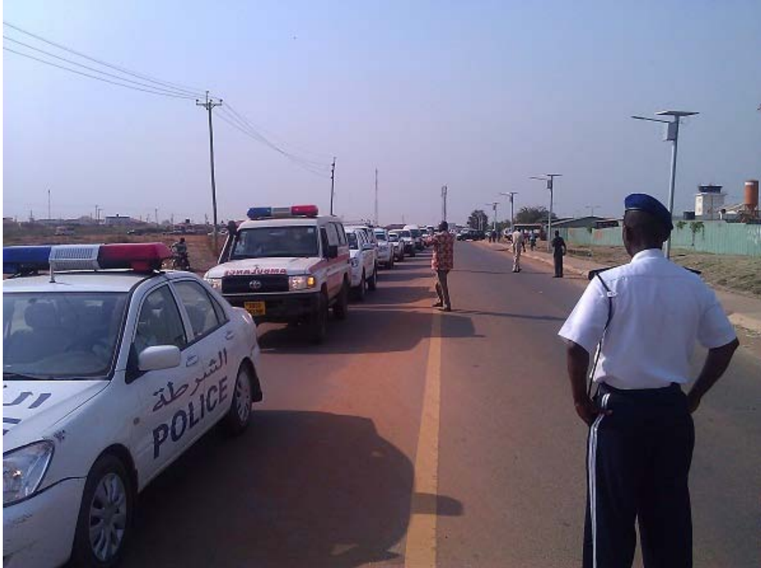
የግርማዊነታቸው አስከሬን ወደ ጁባ ሲጓጓዝ