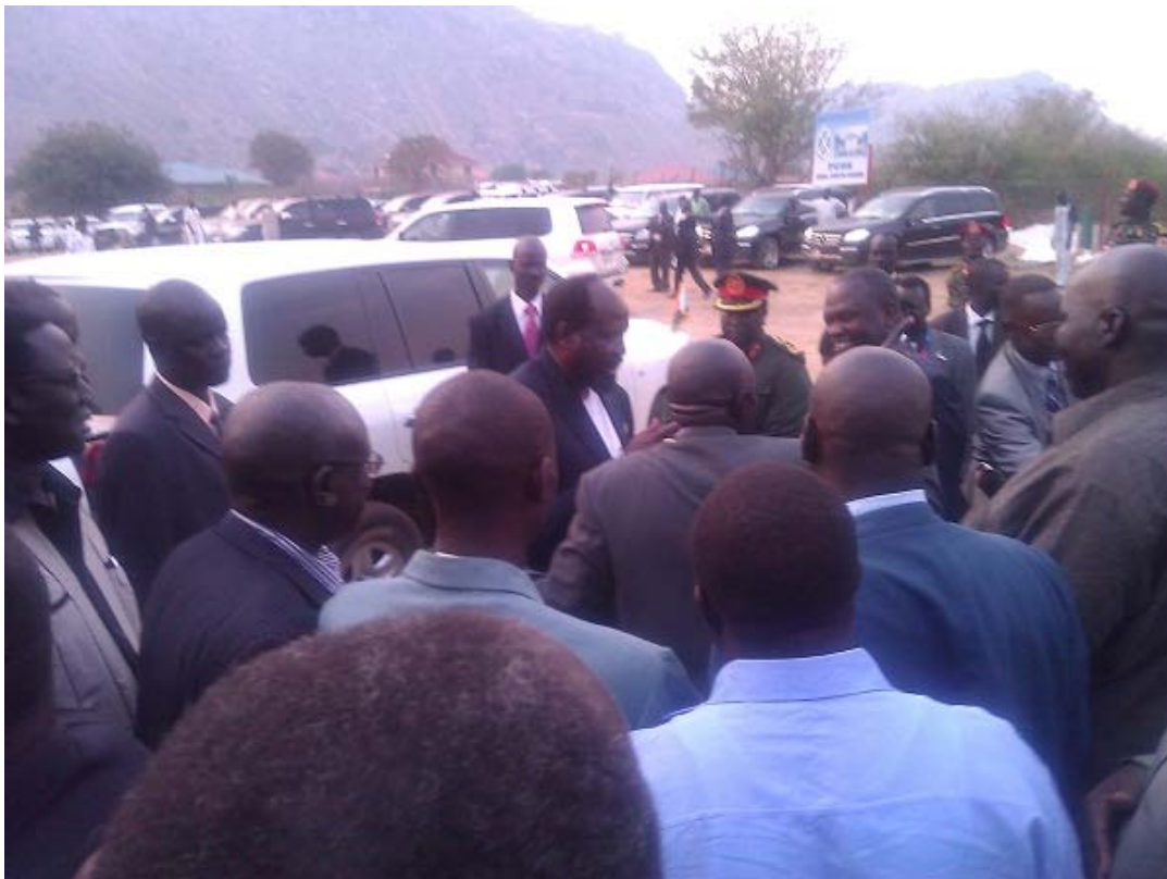
የቤ/ክ አገልግሎት ከተጠናቀቀ በኋላ ፕሬዚዳንት ሳልቫ ኪርና ምክትል ፕሬዚዳንት ሬክ ማቻር ከሐዘንተኛው ጋር የመሰነባበቻ ቃል ሲለዋወጡ