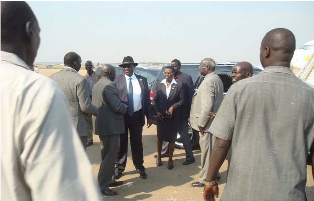
የደቡብ ሱዳን ምክትል ፕሬዚዳንት በአውሮፕላን ማረፊያው ሲደርሱ አቀባበል ሲደረግላቸው