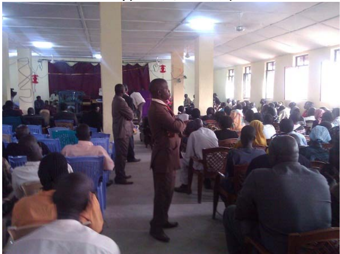
የደቡብ ሱዳን ፕሬዚዳንትና ምክትላቸው በተገኙበት የቤ/ክ አገልግሎት ሲካሄድ